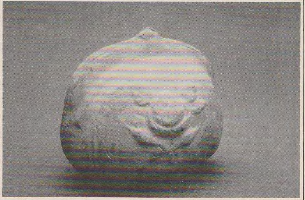
Afb. 7 onder