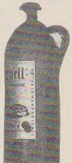
Afb. 2 boven Afb. 3 onder