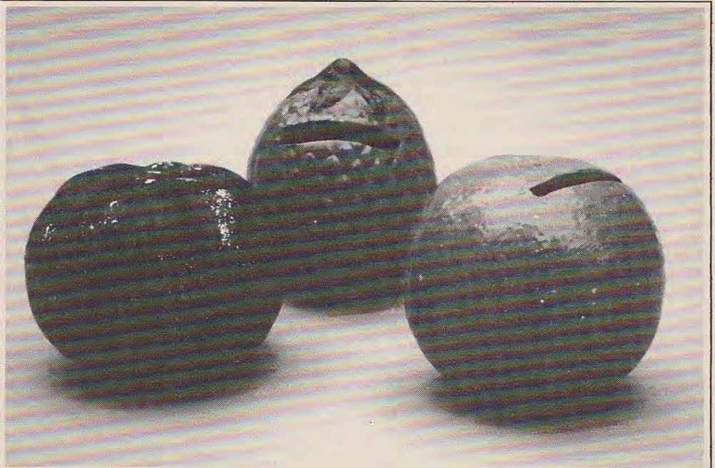
Afb. 6 boven